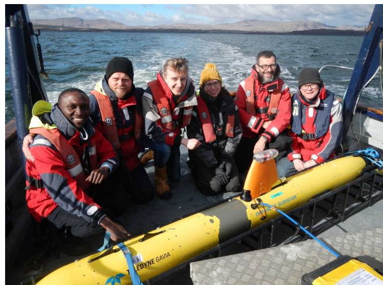
Une équipe de scientifiques de MarPAMM en expédition pour améliorer la cartographie de l'habitat en utilisant le véhicule sous-marin autonome « Freya ».