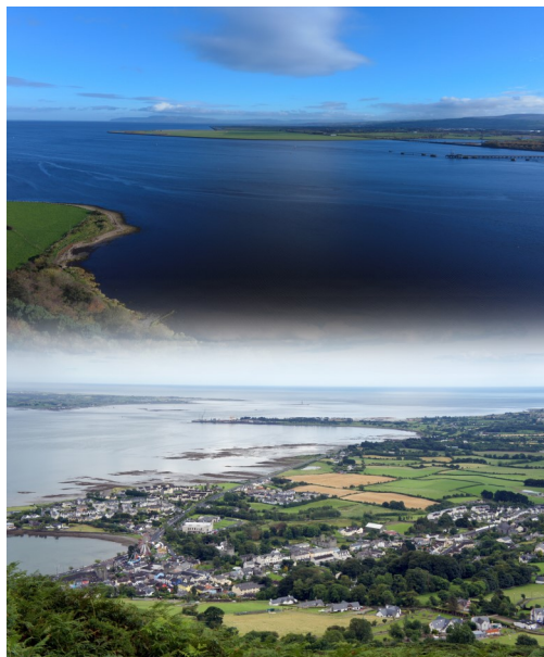
Vue aérienne du lac