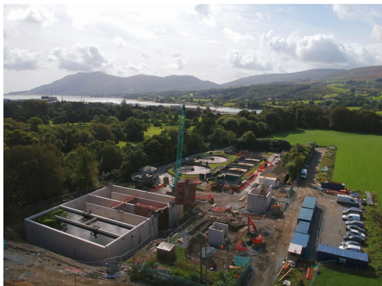
Station d'épuration de Warrenpoint

Le projet offre aux deux compagnies des eaux une occasion bienvenue de travailler en collaboration afin d'établir des priorités et d'harmoniser les projets de manière coordonnée de manière à avoir un impact positif maximal sur les masses d'eau partagées sur l'île d'Irlande ».