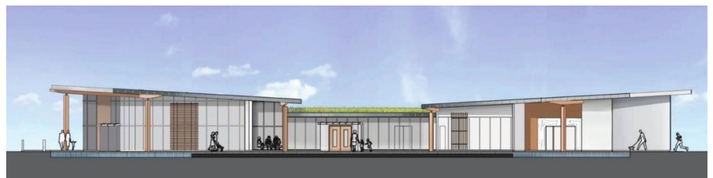
Composition graphique du bâtiment du projet Riverine