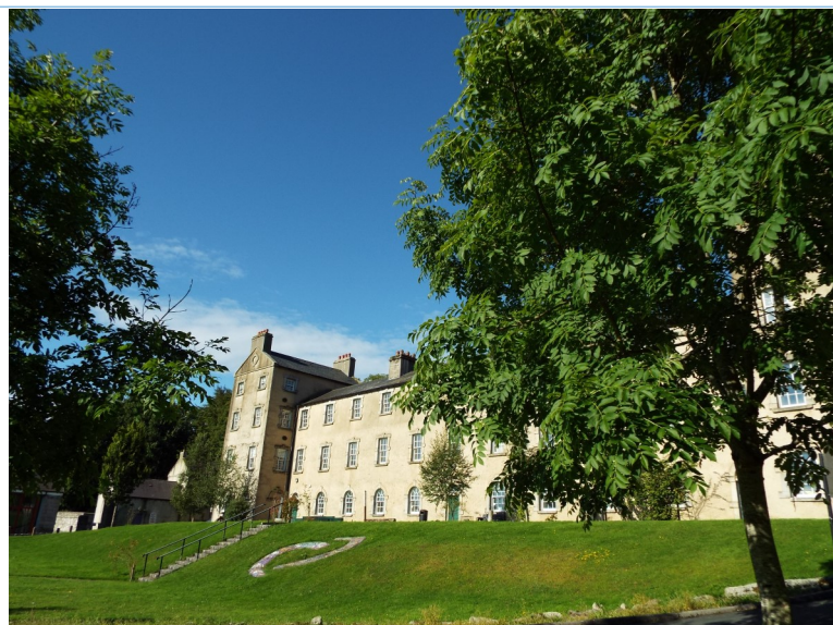
Glencree Centre for Peace and Reconciliation [Centre Glencree pour la paix et la réconciliation], Wicklow