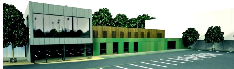
Rendu 3D du complexe sportif

Ce site nouvellement aménagé sera accessible à un grand nombre de groupes, dont : les groupes communautaires, les groupes de jeunes, les écoles, les églises, les clubs sportifs, et les habitants de Belfast, tout en les intégrant à la famille des « services de sécurité publique ». Ce projet vise à promouvoir la réconciliation entre les communautés et le soutien de ces dernières envers les services de sécurité publique, au moyen d'une participation et d'un engagement actifs dans les activités sportives.