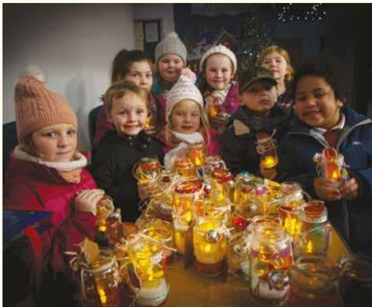
Des enfants ont pris part à la procession aux flambeaux.

Géré par le Waterside Neighbourhood Partnership, en lien avec l'Irish Street Community Association et Hillcrest Trust, le projet permettra la mise en œuvre d'un ensemble de programmes intercommunautaires et de réconciliation pour les personnes de tout âge dans cette zone d'interface.