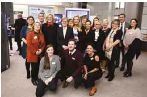
Des représentants de projets PEACE et INTERREG actuels et antérieurs ont pris part à l'exposition.