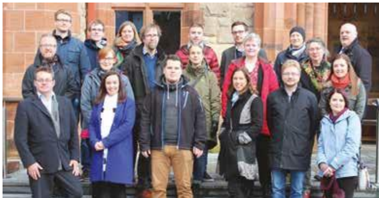
Les membres du groupe de surveillance du programme CLIMATE

Les modèles de bonnes pratiques seront identifiés afin d'élaborer l'échelle de préparation et les registres des risques de façon à éclairer la création de plans d'adaptation au climat.