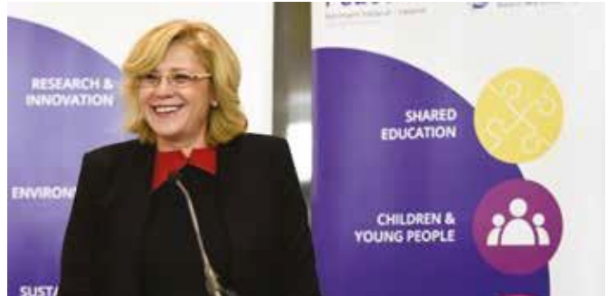
La Commissaire européenne Corina Crețu s'est adressée au public lors de la réception.