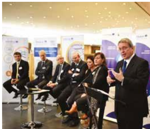
L'ambassadeur irlandais auprès de l'UE, Declan Kelleher, a résumé l'importance du financement européen pour l'Irlande.