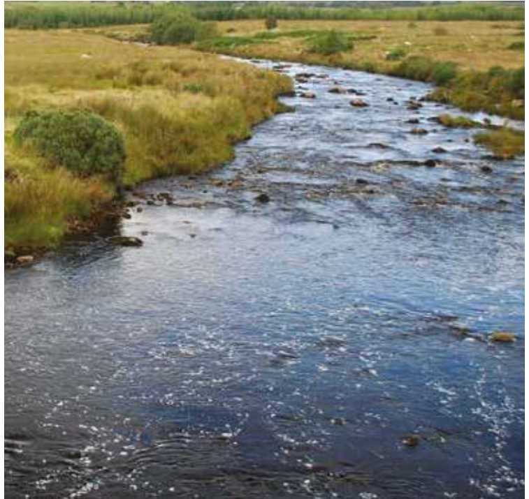
Le nouveau projet environnemental financé par le programme INTERREG VA permet d'améliorer la qualité de l'eau des bassins versants d'Erne et de Derg.

« En travaillant ensemble, nous pourrions, tout d'abord, protéger la qualité de l'eau brute à la source au sein des deux juridictions en diminuant la quantité