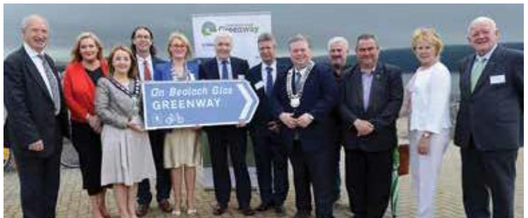
Les membres du Comité d'East Border Region JeCathaoirleigh du Conseil du comté de Louth et le Conseil du district de Newry, Mourne et Down.

Ce projet a été cofinancé par le ministère du Logement, de l'Urbanisme et des Collectivités locales d'Irlande et le ministère de l'Agriculture, de l'Environnement et des Affaires rurales d'Irlande du Nord.