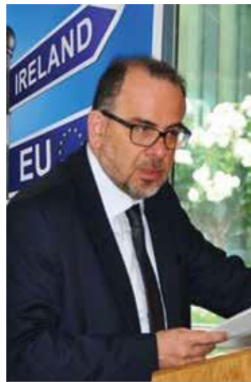
M. Luca Jahier intervenant lors de l'événement.

Intervenant lors de l'événement, Luca Jahier, Président du groupe des « Activités diverses » du Conseil, a déclaré : « Une chose est sûre : la plupart des conséquences du Brexit seront ressenties par des acteurs de plus petite taille tels que les PME, les familles, les individus, et les communautés locales. Qu'en est-il des droits des individus ? Des droits au travail, à la consommation, à la sécurité, tous les droits européens dont jouissent les citoyens britanniques en raison de leur appartenance à l'UE ? Comment ces droits seront-ils défendus une fois le Royaume-Uni hors de l'UE ? »