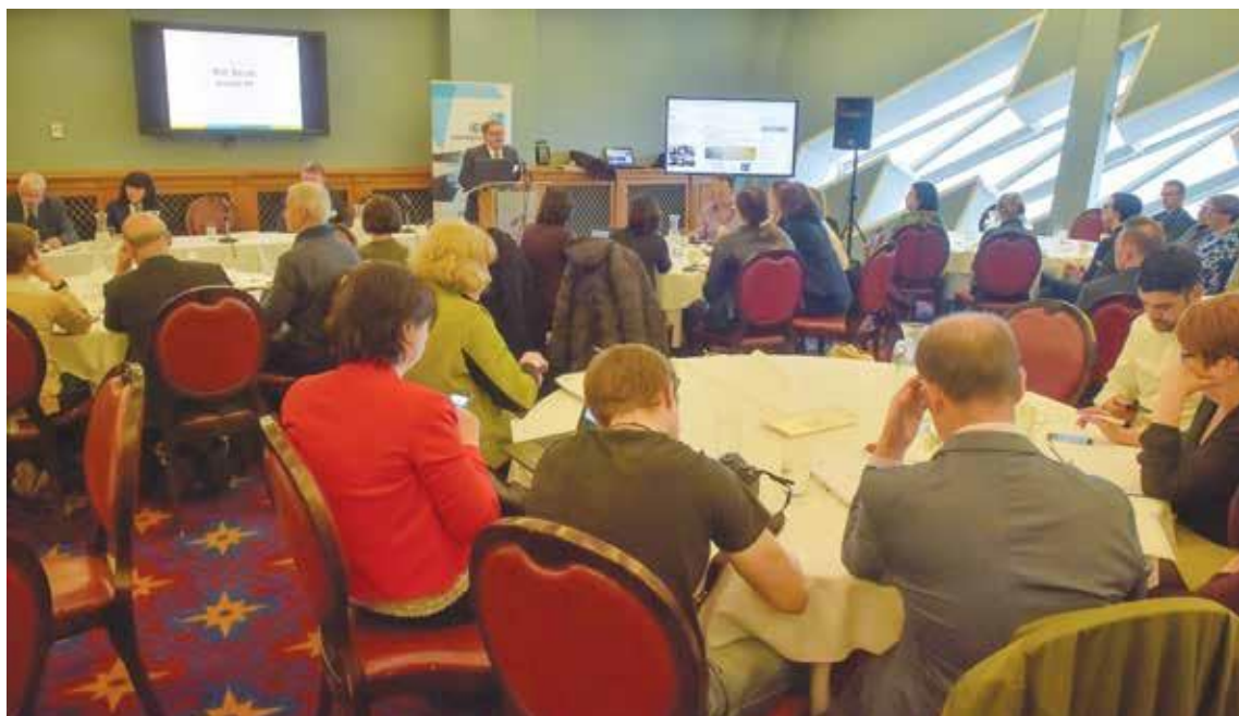
Les jeunes entrepreneurs étaient le sujet de conversation lors de la dernière conférence de la NILGA intitulée « All Island Learning Camp ».

La NILGA déploie d'importants efforts pour encourager le développement à l'échelle du programme de l'entrepreneuriat des jeunes et des municipalités et a obtenu en 2015 le prix de la « Région européenne entreprenante de l'année », une distinction récompensant les stratégies exceptionnelles qui encouragent l'entrepreneuriat et promeuvent l'innovation parmi les petites et moyennes entreprises (PME).