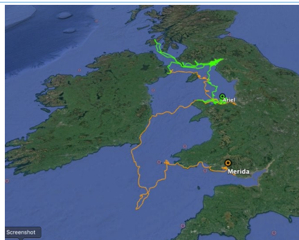
Données de suivi d'Ariel et Mérida