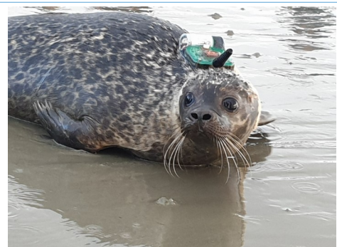
La balise attachée au phoque