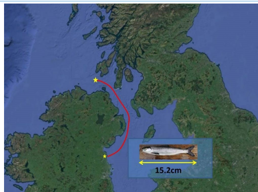
Parcours de migration du saumon

« Les populations de saumons étant en déclin dans l'hémisphère nord, il nous faut de toute urgence établir leur parcours de migration et déterminer les problèmes éventuels susceptibles de nuire à leur survie le long de cette route. Cette étude constitue une étape déterminante et elle jouera un rôle essentiel en appuyant les efforts de conservation marine. »