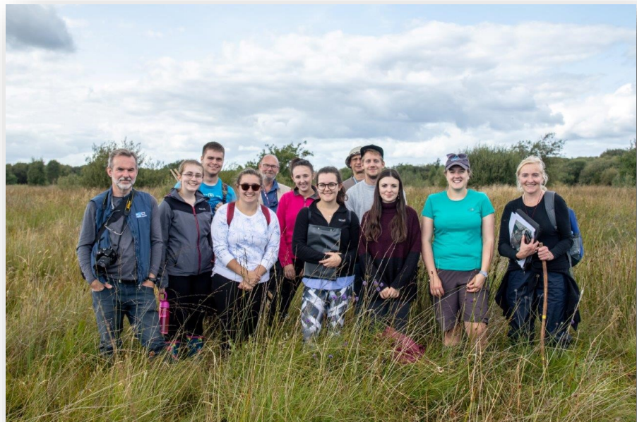
Des bénévoles du projet CABB surveillent le damier des marais.

RSPB NI rédigera des plans d'action de conservation pour la ZSC du plateau du Garron, la ZSC du plateau de Montiaghs Moss dans le comté d'Antrim et la ZSC du plateau de Pettigo dans le comté de Fermanagh, en travaillant avec les propriétaires fonciers et en les aidant dans la gestion de ces sites précieux, tandis que Butterfly Conservation travaille avec les propriétaires fonciers et des bénévoles dans plusieurs sites pour améliorer les conditions du damier des marais.