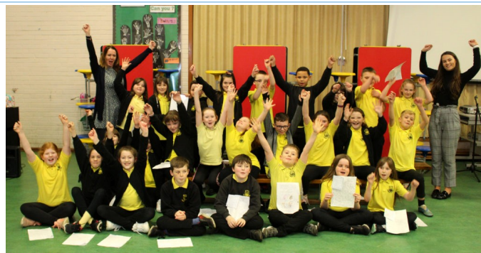
Des élèves de l'école primaire Belmont et leur enseignante