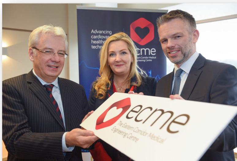
Des partenaires du projet en compagnie de la présidente du SEUPB lors du lancement officiel du projet ECME.